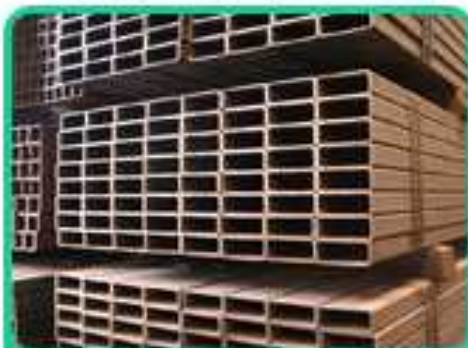
一般構造用角形鋼管