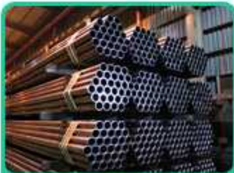
機械構造用炭素鋼管