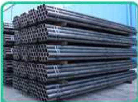
一般構造用炭素鋼管