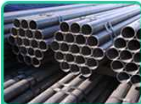
配管用/圧力配管用炭素管